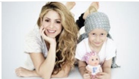
La baby pelones di Shakira

Sono nate nel 2014, si chiamano Baby Pelones e la loro vendita finanzia progetti di ricerca: in collaborazione con l'Istituto dei Tumori di Milano scelto un progetto per lo studio molecolare dei tumori rari